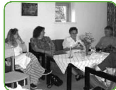
Tid til snak og samvær