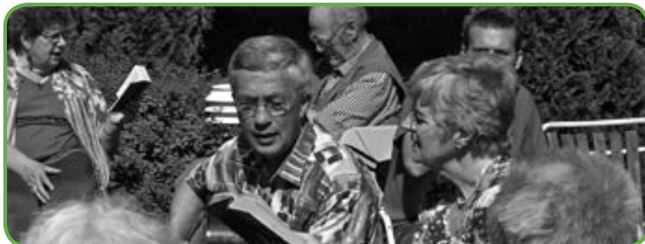
Lovsang i det grønne

Den Gyldne Alders Lejr afholdes i år i Kristi Himmelfartsferien d. 25.-28. maj.