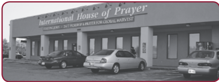
International house of Prayer

brud klar og kaldet lyder over hele jorden.