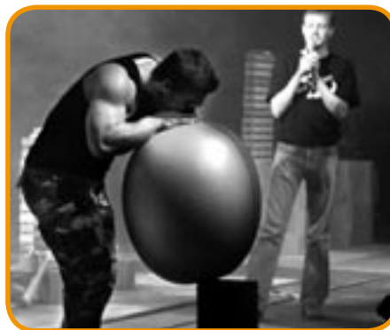
Team X-treme optræder