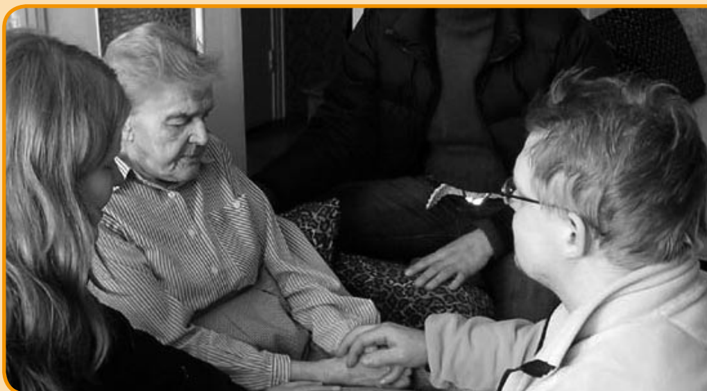
Maduddeling incl. forbøn i Talsi

Vi boede på en UMO base i en by, der hedder Talsi. Vores hovedopgave var at dele mad og tøj ud til de ca. 800 mest trængende i byen. De fødevarer, vi skulle bruge, blev købt i Letland, og vi pakkede dem i nogle poser, som blev delt ud. Hver gang vi skulle besøge en familie, spurgte vi, om vi måtte bede for dem, og det måtte vi altid gerne. De familier, vi besøgte, havde virkelig brug for Guds omsorg og hjælp, for de levede under meget trange kår. Dårlige lejligheder, ingen penge til mad, ingen/ eller ringe hjælp til pleje af ældre og syge. Så der er virkelig et behov