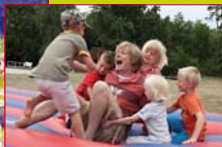
På familielejrene er der plads til både dybde, leg og hygge