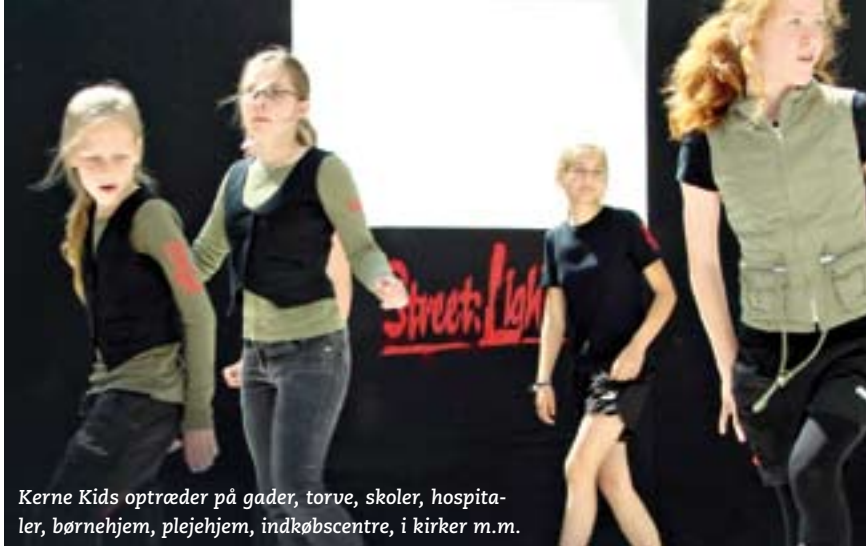
Kerne Kids optræder på gader, torve, skoler, hospita- ler, børnehjem, plejehjem, indkøbscentre, i kirker m.m.