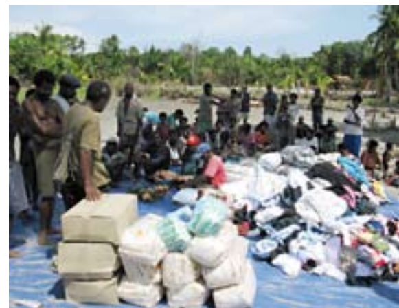
Nødhjælp bragt ud

Ja, ilden spreder sig. Gud er god og kan vende den værste krise til noget, der kan fremme Hans rige. Høsten er bare så stor... hvem er villige til at være med?