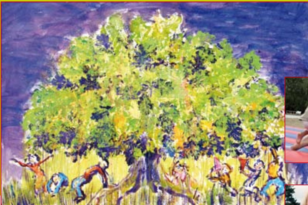
Karsten Auerbachs billede "Lys Under Egetræet" fra lejren i Fjellerup.