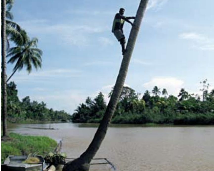
Her gik vandstanden til under stormen

på sit højeste, og Kainde stod i vand til knæene. Vi holdt alle vejret... ville landsbyen bestå? Hvor mange huse ville blive ødelagt af væltede træer? Hvor meget ville bølgerne rive med?