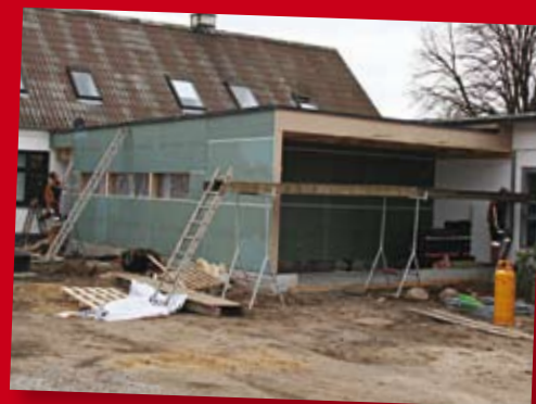
Facaden på det nye køkken er næsten færdig

Køkkenbyggeriet skrider godt fremad, og det udvendige er i skrivende stund ved at blive afsluttet. Mange