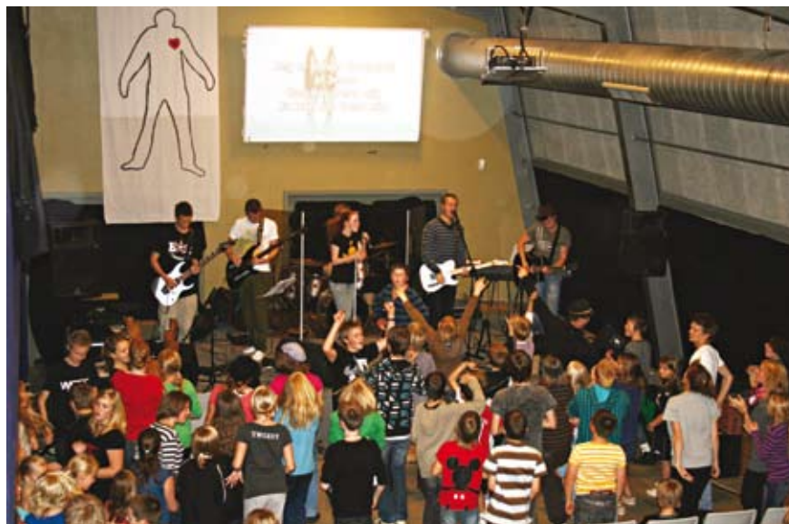
Fuld gang i herlig lovsang på KKI lejr