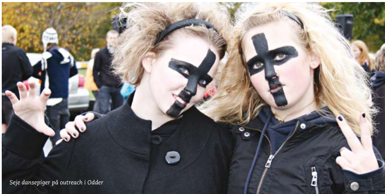
Seje dansepigler på outreach i Odder