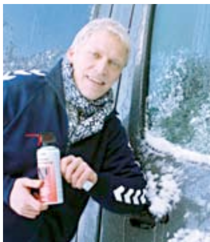
Vinter i Norge kræver vedligehold

Det ved Gud... Derfor er jeg i en proces sammen med ledergruppen, hvor vi be'r og søger retningen for, hvor og hvordan vi skal satse fremover. Mission står højt