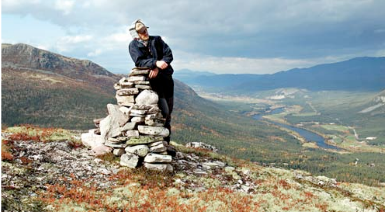
Når man kommer fra Amager, er det dejligt at kunne indtage en fjeldtop

De fleste ved, at vi er kristne, og mange kommer netop på "Lyspunktet", fordi der er så god en atmosfære. Det er et vidnesbyrd om Guds godhed.