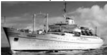
Anastasis - Mercy Ships

Adskillelsen fra UMO sker med den internationale UMO ledelses velsignelse, men det er naturligt nok med blandede følelser, at vi nu ser et familiemedlem forlade familien.