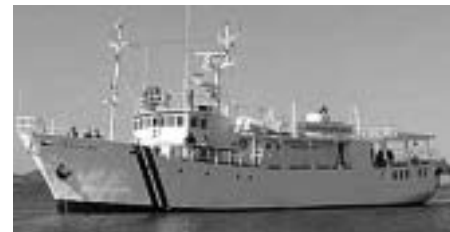
Pacific Link - Marine Reach

Marine Reach er navnet den tjeneste i UMO, som Pacific Link og lignende maritime projekter fremover kommer til at fungere under. Informationer om Marine Reach kan ses på www.marinereach.org eller indhentes ved henvendelse til det nye Marine Reach kontor på Sjellebro.