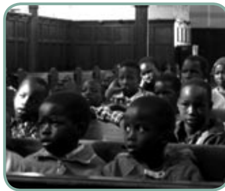
Søndagsskole for sudanere

Ved homebanking brug: Reg.nr.: 1199 Konto nr. = Giro nr.