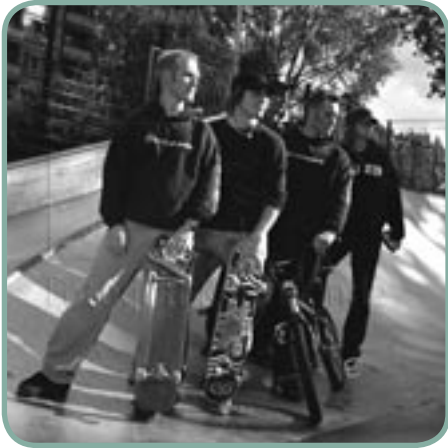
GX skatere og biker

Fra den 21. – 24. april optræder GX International og Team X-treme i Haderslev Idrætscenter og fra 28. april – 1. maj i Forum i Horsens.